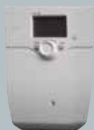
Solarregler LOGON B SOL