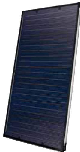
SOLATRON S 2.5 V (vertikal)

Der Schlüssel für die optimale Warmwasserbereitung und Heizungsunterstützung mit Hilfe der Sonne liegt in der perfekten Abstimmung der Komponenten. ELCO bietet Ihnen komplette Solarsysteme. Dazu zählen Solar-, Brauchwasser- und Pufferspeicher in vielen verschiedenen Größen für eine optimale Auslegung der Solaranlage an Ihre Anforderungen. Pufferspeicher können die erzeugte Wärme über längere Zeiträume speichern. Solarregler sorgen dafür, dass die auf dem Dach gewonnene Wärme so effektiv wie möglich genutzt werden kann. Dazu kommt eine spezielle ELCO Pumpengruppe als Basis- und Kaskadenmodul.