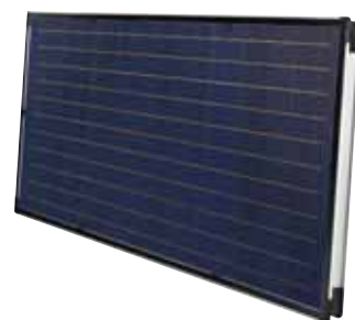
SOLATRON S 2.5 H (horizontal)